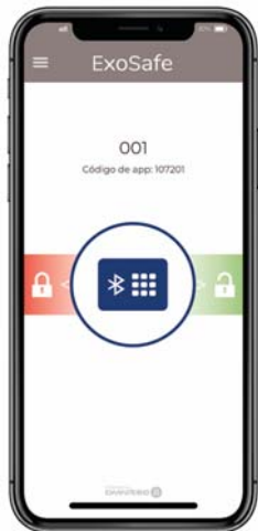
apertura & administración